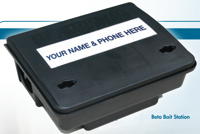
Beta Bait Station

โรเดินธอร์ บล็อก เบท โรเดินทีไซด์ นั้นสามารถใส่ในสถานีเหยื่อได้อย่างพอดี นอกจากนี้กล่องใส่เหยื่อโรเดินธอร์ทุกแบบจะสามารถตั้งพิมพ์โลโก้ และเบอร์โทรศัพท์ บริษัทของท่านลงไปได้